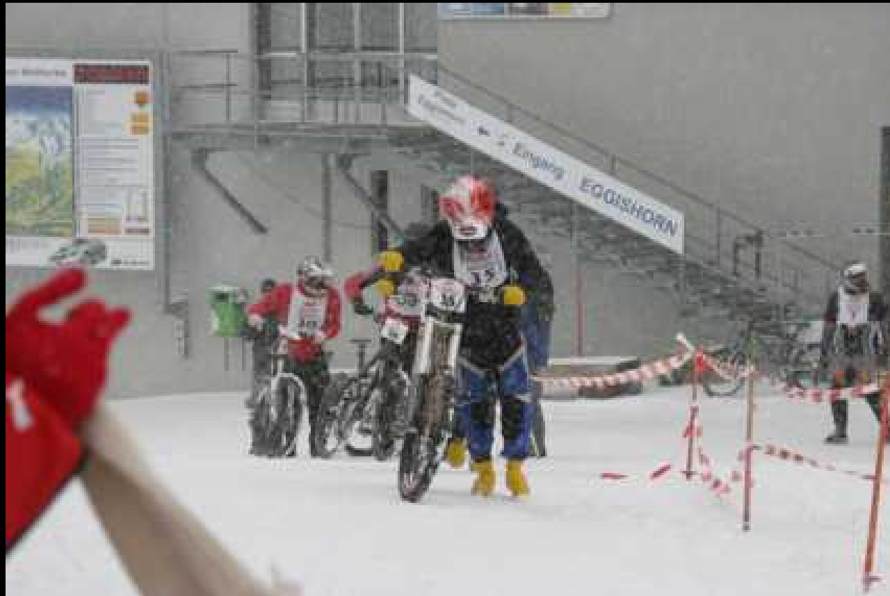
8. Etappe Mountainbiker