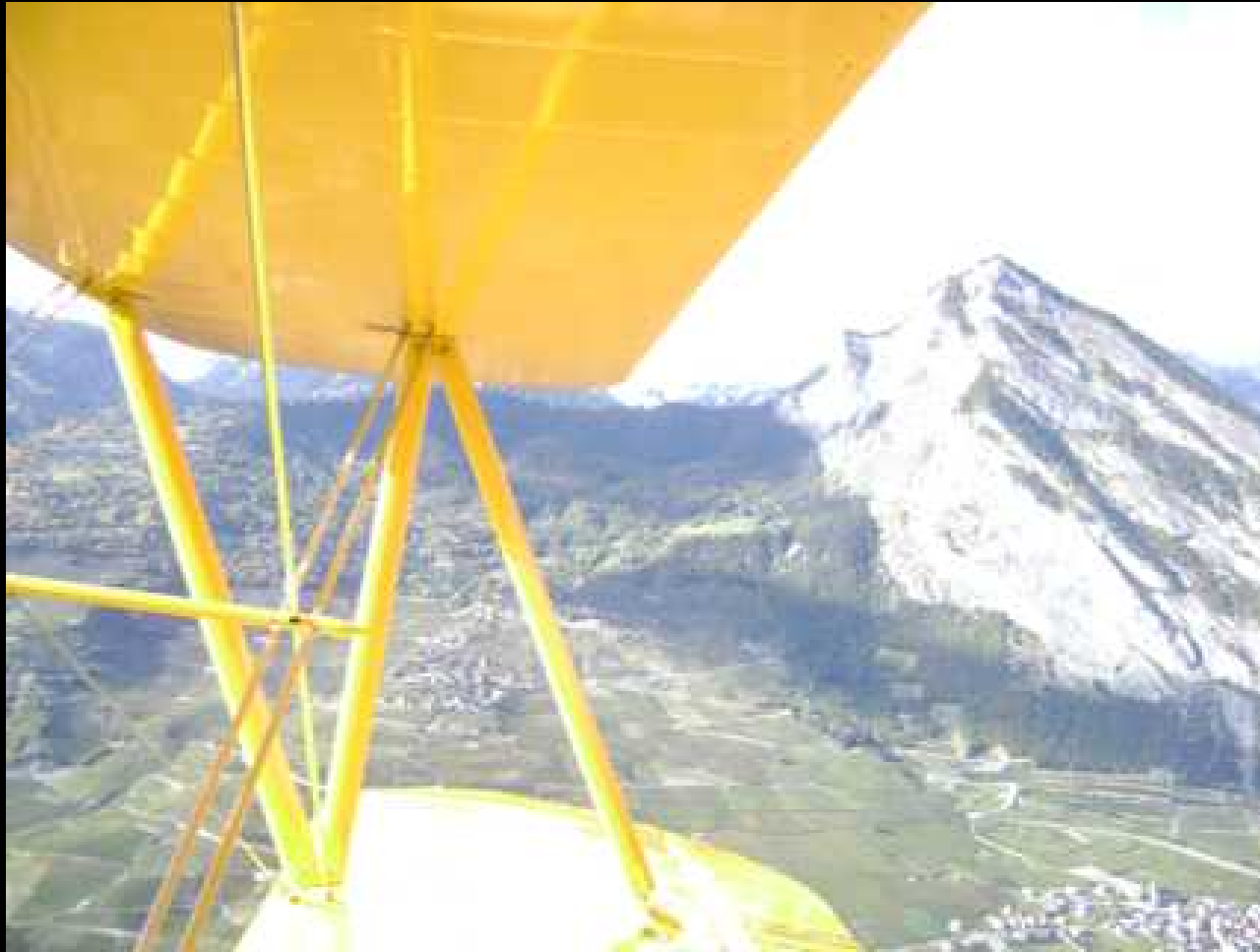
Ausweichroute via Mittelland