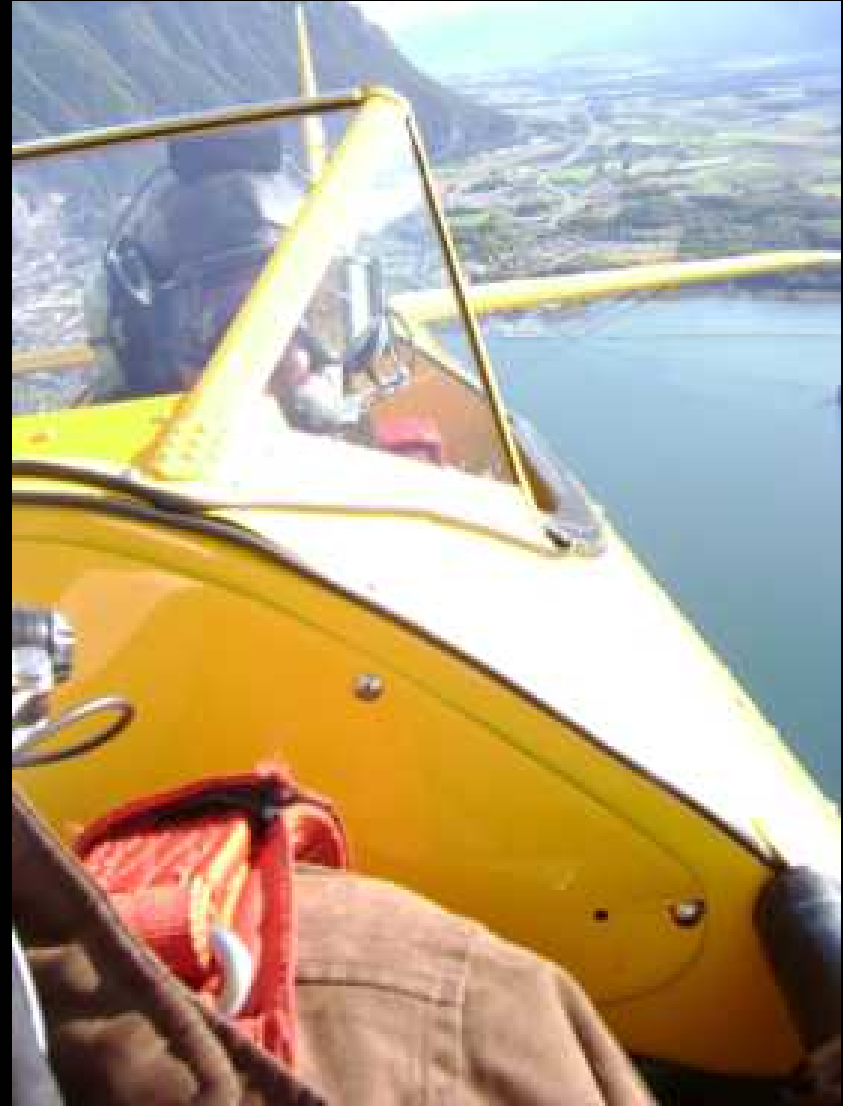
Über dem Genfersee