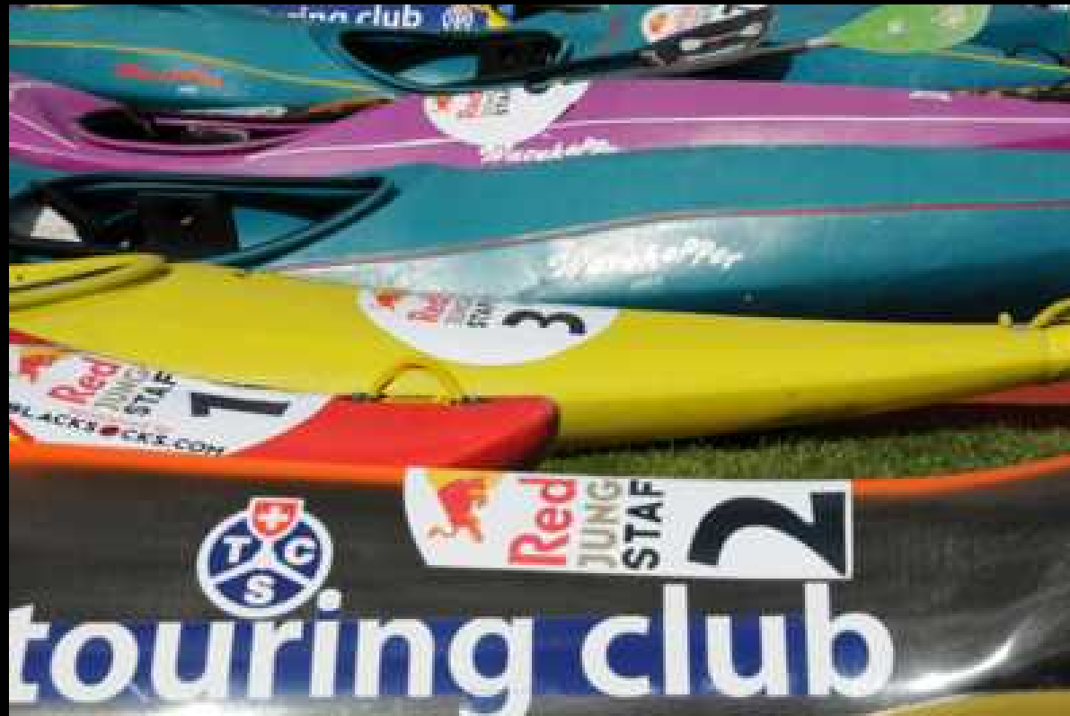
10. Etappe - Kajakfahrer