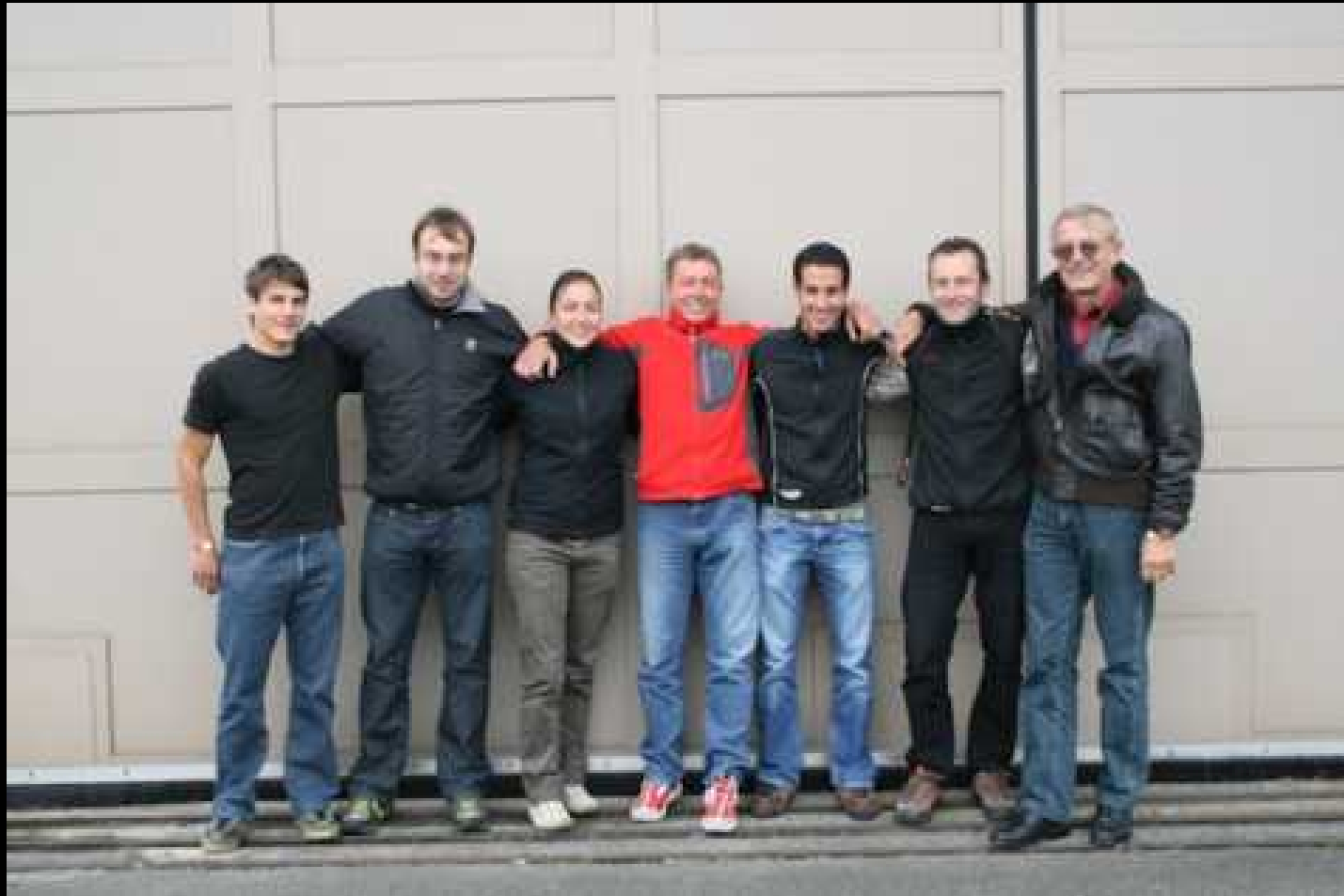
Die erste Hälfte des Teams