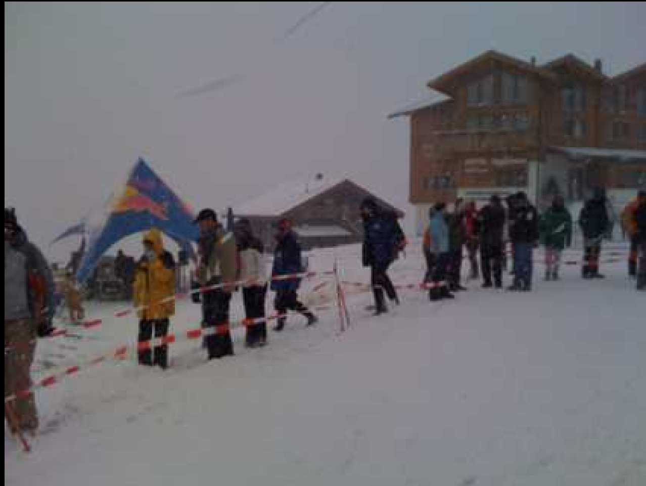
5. Etappe - Gletscherläufer