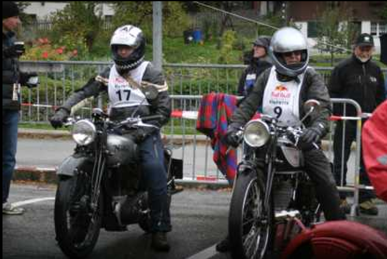
9. Etappe - Oldtimertöff