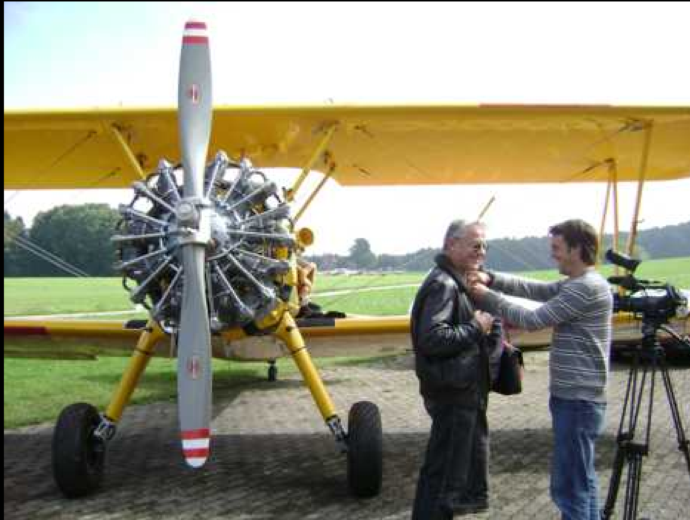
Filmaufnahmen beim Abwurftraining