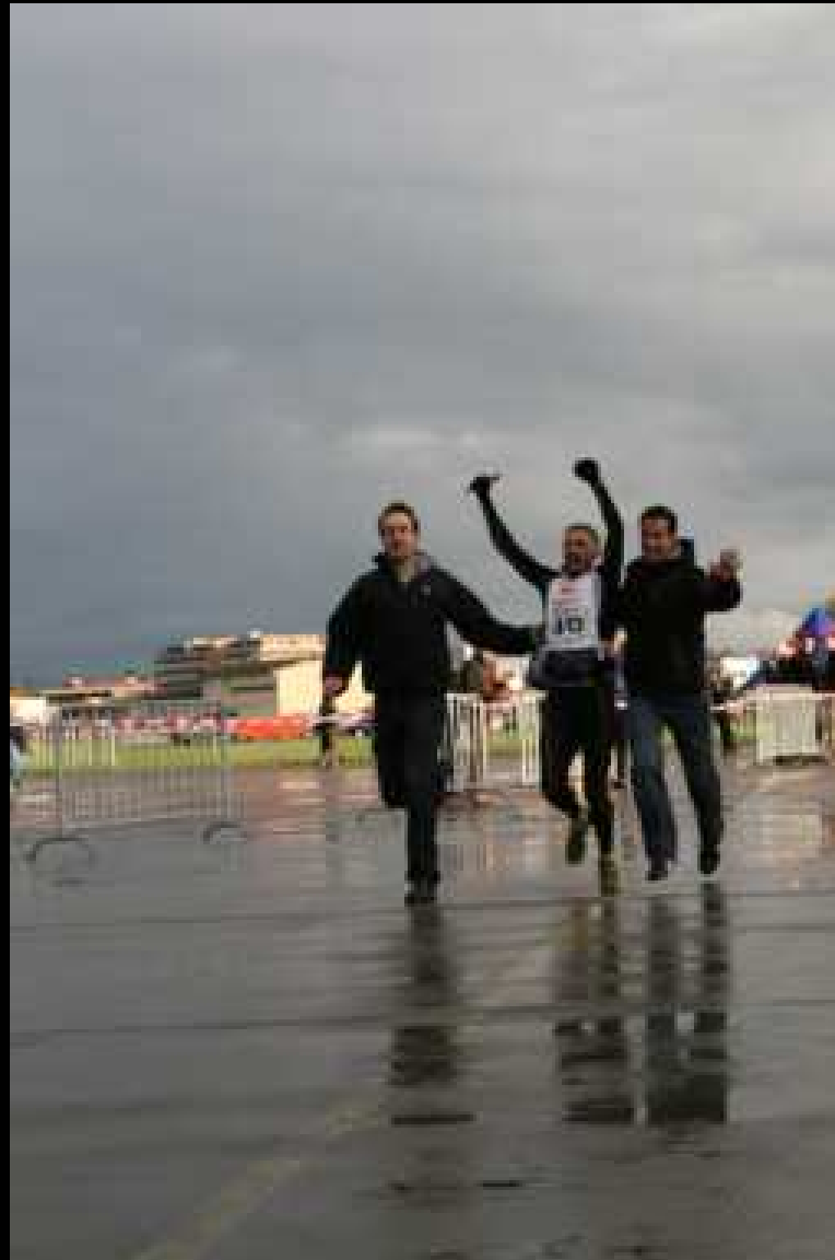
13. Etappe - Schlussläufer