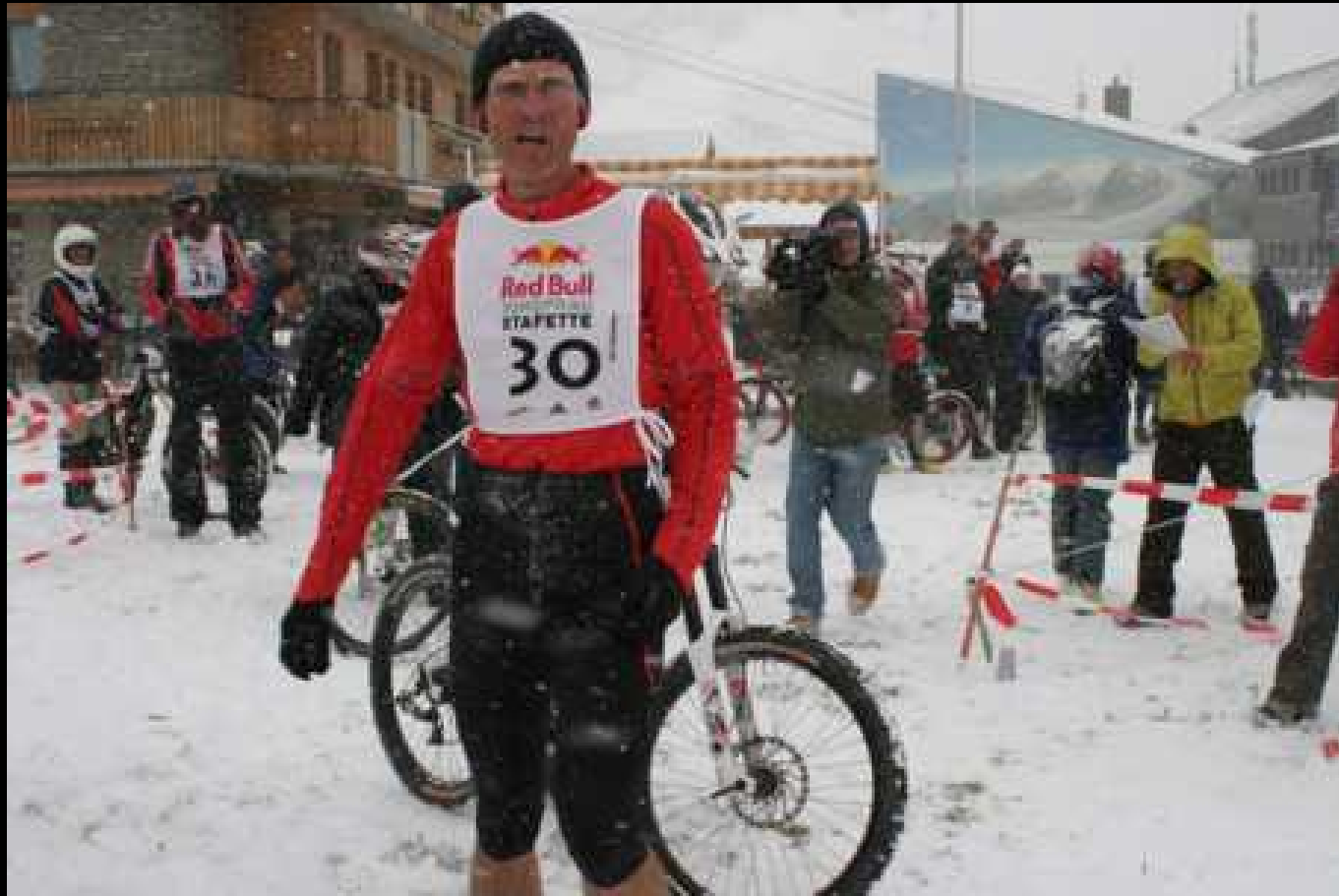
6. Etappe - Bergläufer